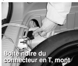
Boîte noire du connecteur en T, monté