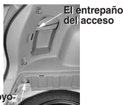
El entrepaño del acceso

Localice el orificio de acceso en el costado del conductor entre la llanta de repuesto y el umbral trasero. Dirija el extremo del conector en T con el alambre amarillo a través del orificio hasta el panel de acceso.