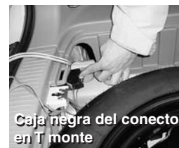
Caja negra del conector en T monte