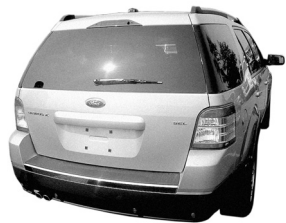
Ford Taurus X