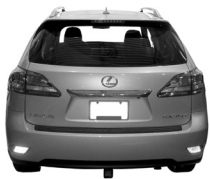
Lexus RX 350