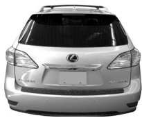
Lexus RX 450h